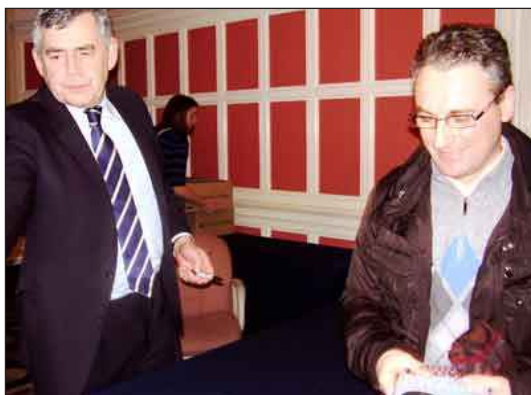
Nelle foto: Gordon Brown (già Primo Ministro del Regno Unito dal 2007 al 2010) e Nunzio Mastrorocco

per garantire davvero che l'economia mondiale non viva di nuovo un'esperienza simile a quella in corso è legato alla costituzione di una 'super-istituzione' di banche che coordini e definisca adeguati piani di intervento destinati a favorire non solo la crescita globale ma un progressivo incremento dell'occupazione. Si rende necessario un riequilibrio delle sostanziali differenze economiche tra i diversi Paesi del mondo. E' auspicabile la cancellazione del debito per i Paesi in via di sviluppo e fortemente arretrati; ciò determinerà quel circolo virtuoso di progressiva crescita e di crescente occupazione con conseguente miglioramento del benessere e positivi effetti indotti per tutto il pianeta. Sono stati numerosi gli 'strumenti' analizzati da Brown e sui quali occorrerebbe investire; ma esigenze editoriali consentono appena di enunciarli: ricerca, innovazione, tecnologia, trasparenza dei mercati, partecipazione diretta alla definizione delle regole del gioco, regolamentazione internazionale dei sistemi monetario, finanziario e fiscale. In definitiva, i problemi ed i rischi di un'economia globale possono risolversi solo mediante soluzioni ed Istituzioni globali. Uscire dalla crisi è possibile e solo il sacrificio di ognuno permetterà il benessere di tutti".