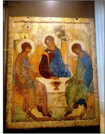
Andrej Rublëv, Icona della Trinità, 1410 circa. Mosca, Galleria statale di Tret'jakov

l'Eucaristia. Anche lo shopping non è mancato come durante la passeggiata per la via Arbat, una delle più antiche di Mosca, ora vivace zona pedonale e commerciale. Straordinario è stata la visita alla metropolitana di Mosca, vero museo sotterraneo della capitale; i suoi arredi in marmo, lampadari in