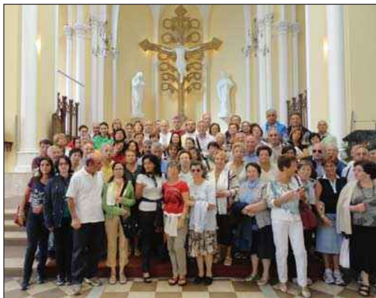
Mosca - Gruppo diocesano dei partecipanti al Pellegrinaggio