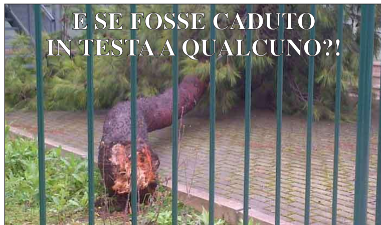
E SE FOSSE CADUTO IN TESTA A QUALCUNO?!