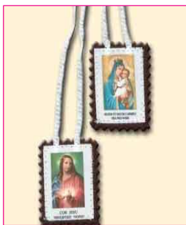
Scapolare o abitino

La Madonna dona lo scapolare a Simone Stok